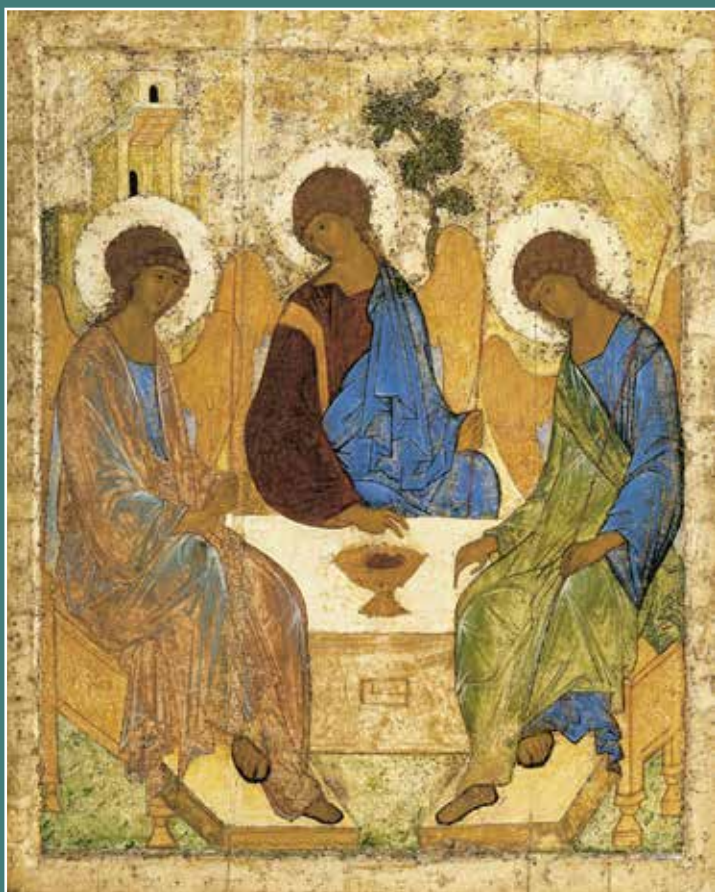
Szentháromság – Пресвятая Троица (Szent) Andrej Rubljov (Андрей Рублёв), (1360 és 1370 között – Moszkva, 1430. január 29.)